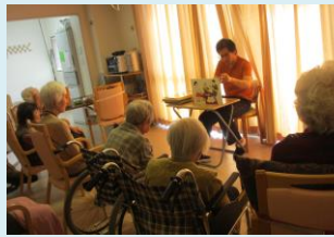
↑ 紙芝居 4F 13