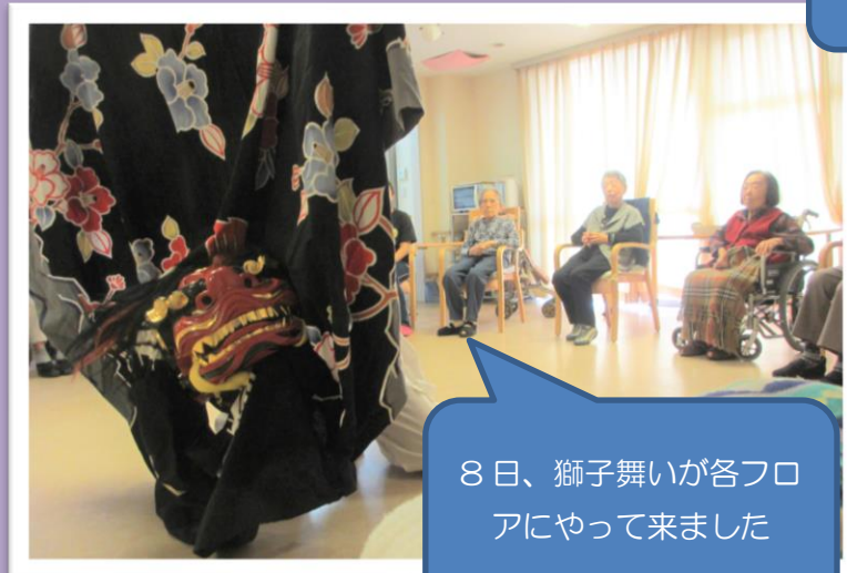
8日、獅子舞いが各フロアにやって来ました

今年、晴天に恵まれた年明けとなりました。一月は、初詣や獅子舞い、三味線の演奏会など、お正月らしい行事を楽しみました。各フロアでも、書初めや福笑いなど、この時期ならではのレクリエーションを行いました。