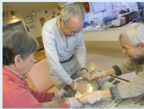
↑ おやつレク 2F 20日