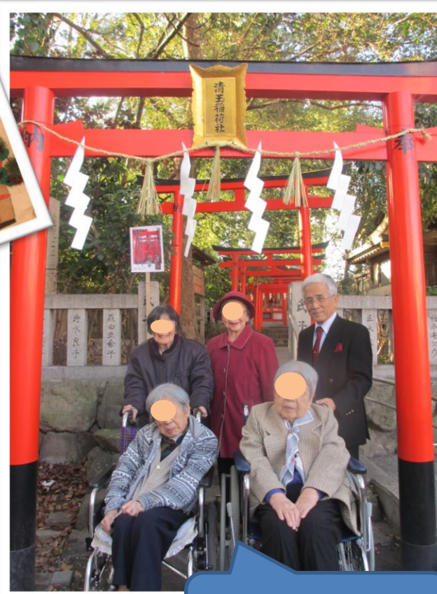
三が日、ご希望者で船越神社へ順次、初詣に