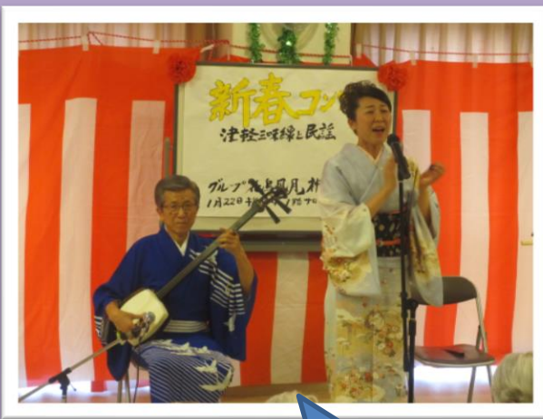
22日、新年のつどい 三味線の演奏を楽しみました。