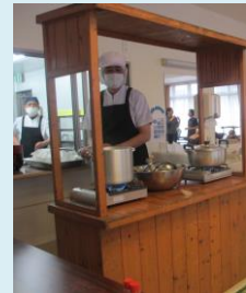
23日 ← うごこの昼食会