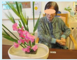
↑ 生花教室 16日 おやつレク 4F 24日 →