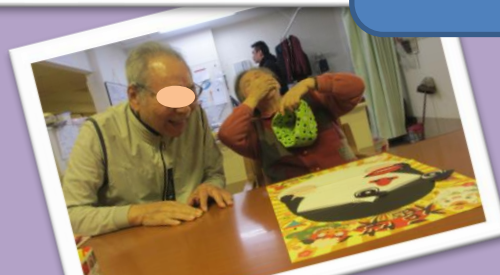
↑フロアのレクで福笑い 書初めも、お正月にちなんだ言葉を一