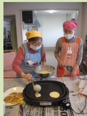
↑2F ホットケーキの おやつレク20日