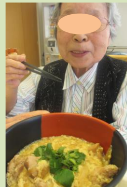
サロン行事(親子丼) ↑ ←3F おやつレク20日