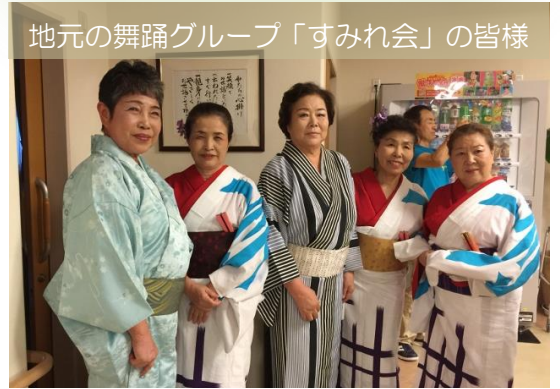
地元の舞踊グループ「すみれ会」の皆様