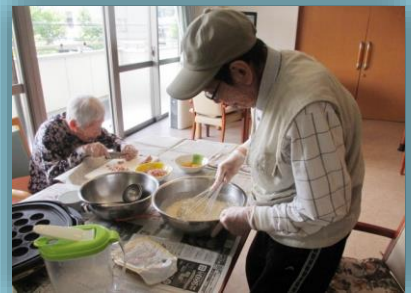
↑2Fたご焼き(7日) \\3Fわらび餅(9日)