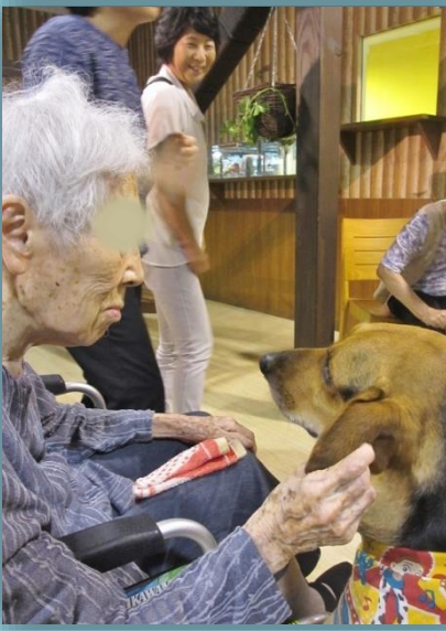
↑動物と戯りたい、と入居者様有志で「天保山 アニパ」へ。高速道路から見える梅田のビル群 に驚かれ、日頃見ることの少ない大型動物にも 触れ合う時間が持てました。(11日)