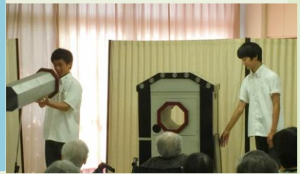
市立尼崎双星高校より マジック研究部←と吹 奏楽部→の皆様の熱演

7月 27 日に恒例の夏祭りを開催。今年は、市立尼崎双星高等学校マジック研究部・吹奏楽部はじめ、舞踊ボランティアのすみれ会、富田婦人会など、地域の皆様にご出演頂きました。尼崎健康医療財団看護専門学校の学生ボランティアさんのご協力も得て、楽しい時間となりました。