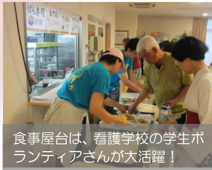
食事屋台は、看護学校の学生ボ ランティアさんが大活躍！