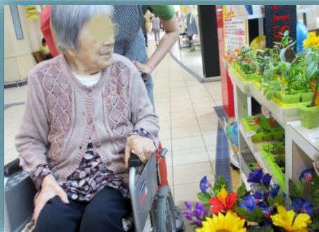
↑15日に希望者でイオン尼崎へ外出レク に。おやつとショッピングを楽しみました。